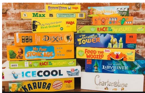
Gesellschaftsspiele Fr. 10.00 - 90.00

Auf dem Viking Holländer sind Koordination, Beweglichkeit und Kraft gefragt! Eine echte Herausforderung an die motorischen Fähigkeiten.