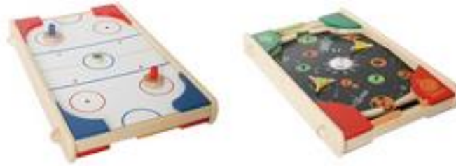
Super Shooter 2 in 1 Fr. 107.00

Ein spannendes Kombispiel, beidseitig bespielbar: Hockey auf der einen, Flipper auf der anderen Seite.