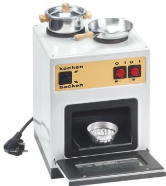
Elektro-Kinderherd Fr. 249.-

Ein spannendes Kombispiel, beidseitig bespielbar: Hockey auf der einen, Flipper auf der anderen Seite.