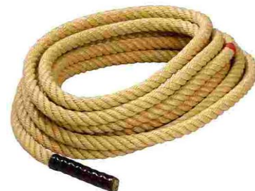
Seil-Ziehen Fr. 60.-

Der Elektroherd bietet Kindern ein besonders authentisches Spielerlebnis. Der Nachwuchs muss nur noch überlegen, welche Leckereien er mit der Hilfe von Erwachsenen zubereiten möchte.