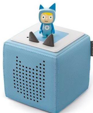
„Tonies-Box:“ Fr. 100.00

Im Jahr kommen mehr als 2000 neue Spiele auf dem Markt. Wir erneuern unser Sortiment laufend.