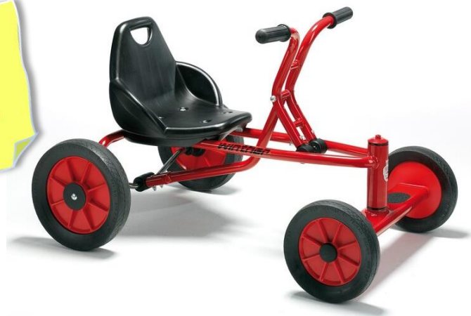
„Viking“ Holländer Fr. 560.00

Auf dem Viking Holländer sind Koordination, Beweglichkeit und Kraft gefragt! Eine echte Herausforderung an die motorischen Fähigkeiten.