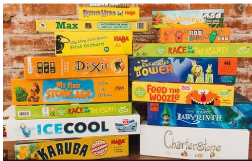
Gesellschaftsspiele Fr. 10.00 - 90.00

Im Jahr kommen mehr als 2000 neue Spiele auf dem Markt. Wir erneuern unser Sortiment laufend.