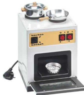
Elektro-Kinderherd Fr. 249.-