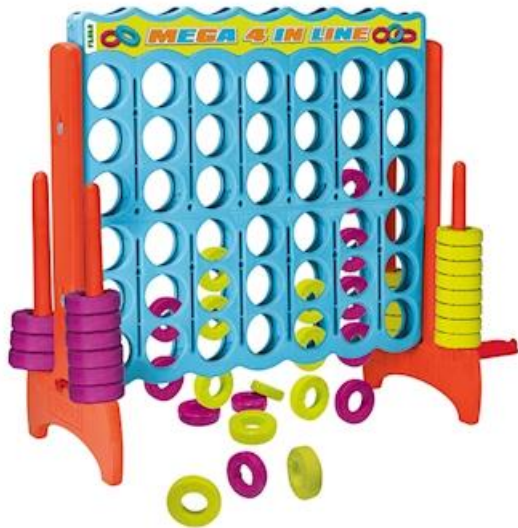
Vier Gewinnt! Fr. 265.00

Eine riesengrosse Ausführung des beliebten Tischspiels.