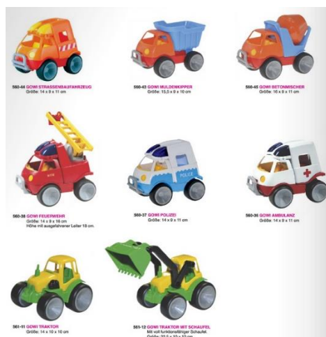
Set mit 8 kleinen Gowi Fahrzeugen Fr. 150.00

Der Elektroherd bietet Kindern ein besonders authentisches Spielerlebnis. Der Nachwuchs muss nur noch überlegen, welche Leckereien er mit der Hilfe von Erwachsenen zubereiten möchte.