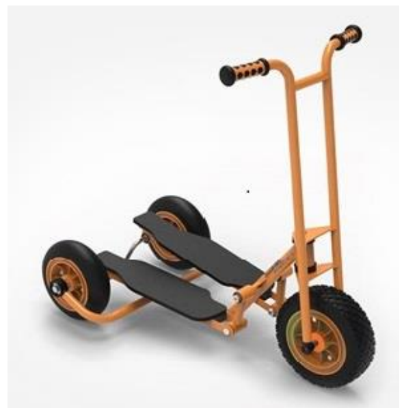
„eltoys“ Stepproller Fr. 399.-

Auf dem Viking Holländer sind Koordination, Beweglichkeit und Kraft gefragt! Eine echte Herausforderung an die motorischen Fähigkeiten.