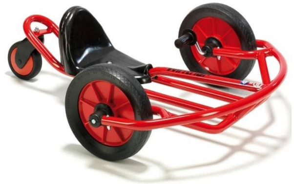
„Viking“ Swingcart – gross Fr. 379.-

Eine riesengrosse Ausführung des beliebten Tischspiels.